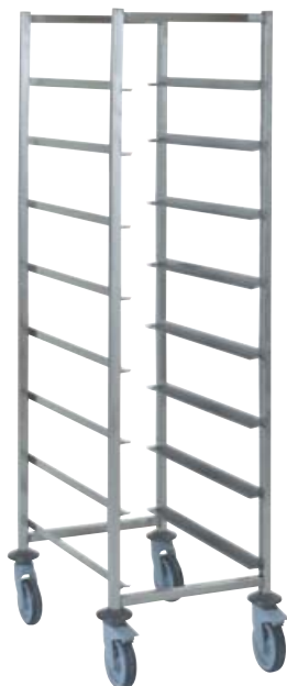
référence 804 193